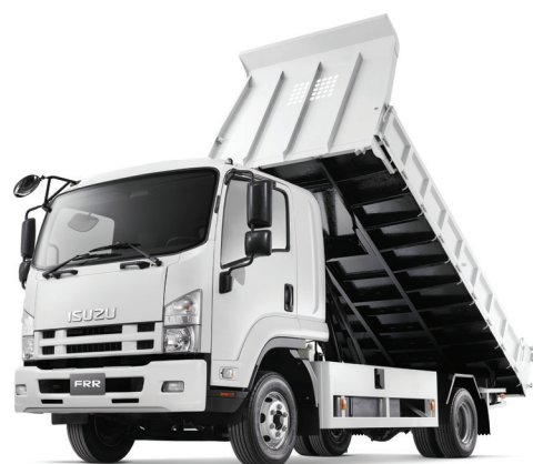
傾卸車車體參考圖